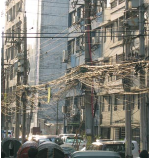
Kabelwirrwarr: Stromausfälle sind in Bangladesh an der Tagesordnung.

Solaranlage funktioniert, gebaut, unterhalten, gepflegt und repariert wird. Unter den Kursteilnehmern ist immer auch ein kleiner Anteil an Frauen, was im überwiegend muslimisch geprägten Bangladesh noch etwas Besonderes ist. Innovativ am Unterrichtskonzept ist, dass es keinen Frontalunterricht gibt. In einer, wie Günter Schumacher anmerkt „auch nach unseren Maßstäben vollständig eingerichteten Werkstatt“ ist praxisorientiertes Lernen das Ziel: „Die Teilnehmer kommen nicht nur täglich zum Unterricht, sondern bauen auch wirklich mal eine Anlage auf.“ Alles wird ausprobiert und jede Gruppe soll in die Lage versetzt werden, später an Anlagen zu arbeiten. In der Trainer-Gruppe, die sich vorwiegend aus Hochschulabsolventen zusammensetzte, ging es außerdem um die Planung und Ausführung der Anlage von der Auftragsannahme, der Kalkulation bis zur Übergabe an den Eigentümer.