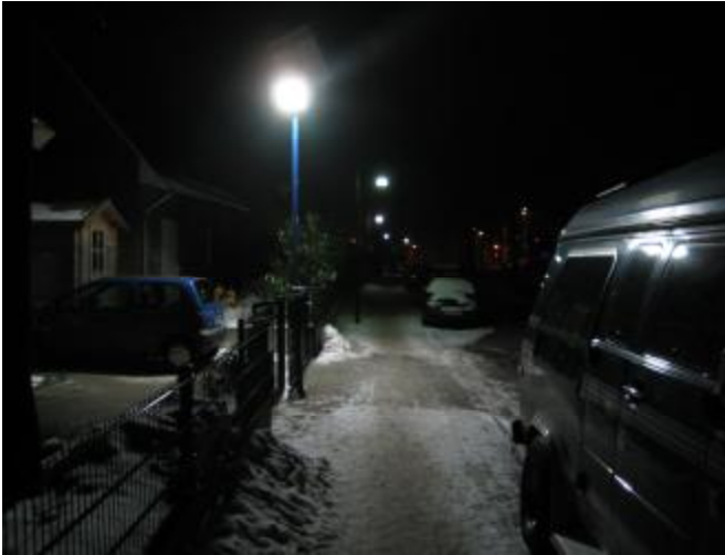
Ausleuchtung mit 90 Watt LED Lampe