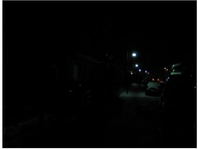
Ausleuchtung mit 50 Watt Natrium Dampfampe